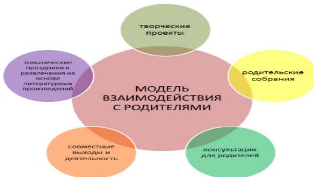
Схема. Модель взаимодействия с родителями.

Работа с родителями является неотъемлемой частью образовательного процесса детского сада. В ДОУ функционирует Совет родителей. Ежегодно разрабатывается план, проведения различных информационно-просветительских и досуговых, учебно-тренировочных и обучающих мероприятий, экскурсий и выходов за пределы ДОО.