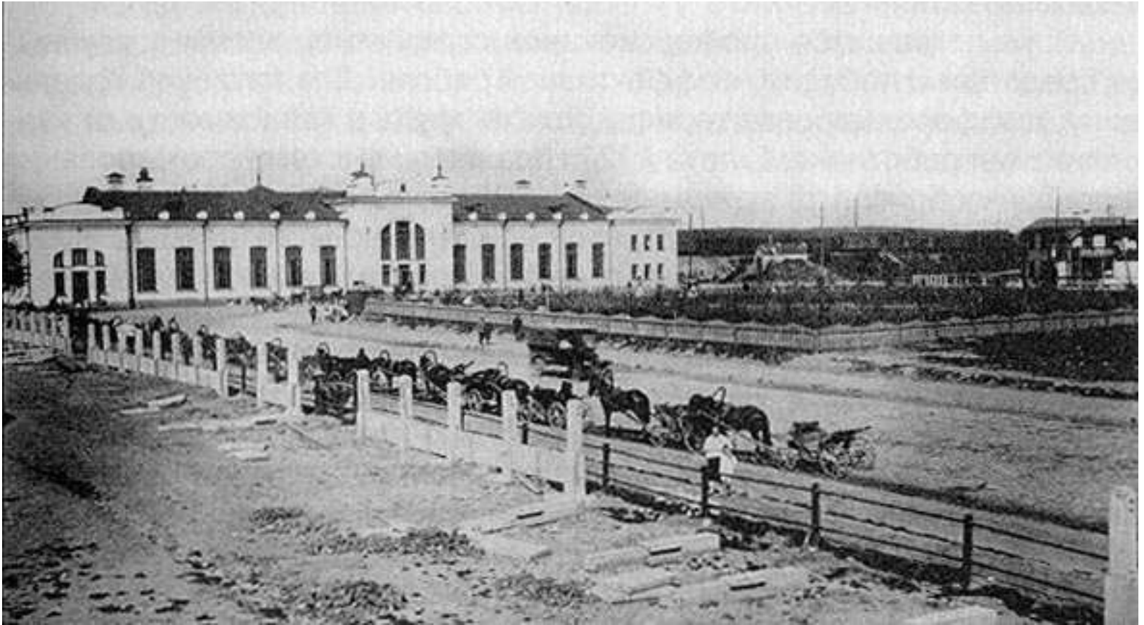
Привокзальная площадь в 1926 году